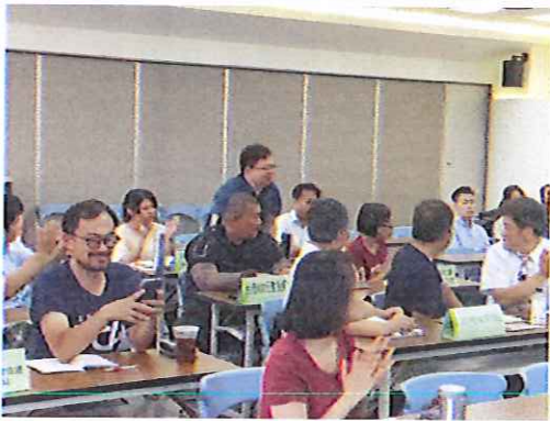
零撲殺後政策後的動物保護座談會