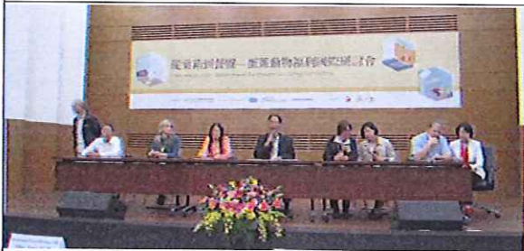
蛋雞動物福利國際研討會