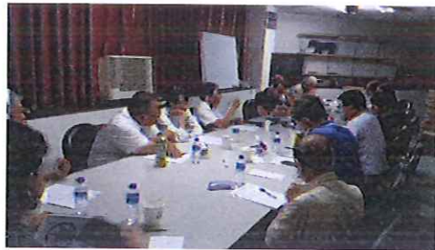
動物保護諮詢團隊訪前會議