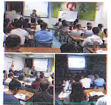
2場獸醫師動物保護 宣導繼續教育研討會 (高雄及台南)