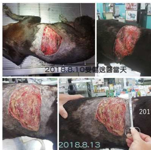
案例 5：馬○○栗-流浪犬 馬黑黑