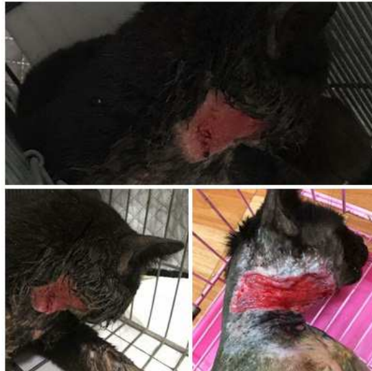
案例 8：吳○維-流浪貓 黑仔