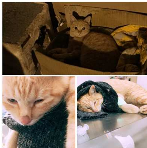
案例 2：王○泯-流浪貓 討厭鬼