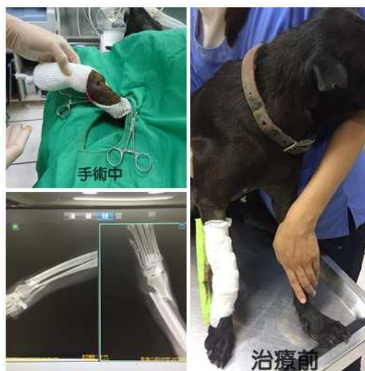
案例 4：黃○榮-流浪犬 亮亮