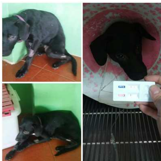
案例 3：鄭○鶯-流浪狗 大寶